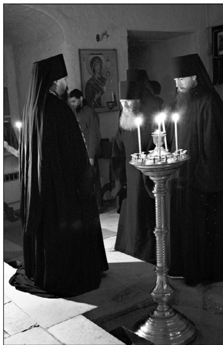
фото икона Вараана