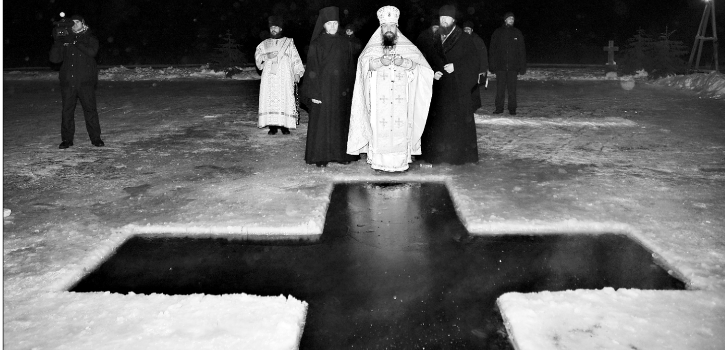
Фото игумена Варлаама.

К празднику Рождества Христова сийская братия начинает готовиться заранее, без торопливости, потому что время поста — время сугубой молитвы. Но надо сходить в лес за елками, чтобы украсить ими храмы, повсюду навести особую чистоту и порядок, приготовить помещения для паломников, загодя запастись продуктами для общей праздничной трапезы.