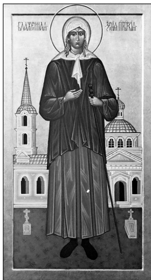
Св. блжж. Ксения Петербургская. Сийская иконописная мастерская.

Происходил из города Мелитины в Армении. На 30-м году жизни ушел в Иерусалим, затем в Фаранскую Лавру, позднее в пустыню для отшельничества. Вокруг св. Евфимия стали селиться боголюбивые люди. Был основан монастырь. Но людская слава тяготила святого, и он еще раз тайно удалился в пустыню. Прп. Евфимий был удостоен от Господа дара исцеления.