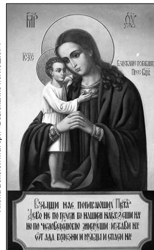
Икона Божией Матери «Взыскание погибших».

18 февраля — икон Божией Матери Елецкой-Черниговской, Сицилийской, или Дивногорской, и именуемой «Взыскание погибших».